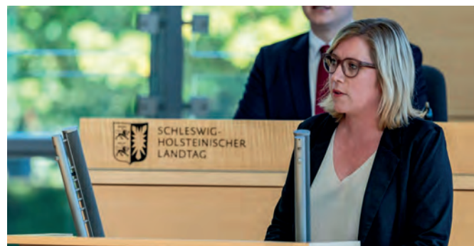
Wiebke Zweig Mitglied des Landtages

Minister für Wirtschaft, Verkehr, Arbeit, Technologie und Tourismus des Landes Schleswig-Holstein